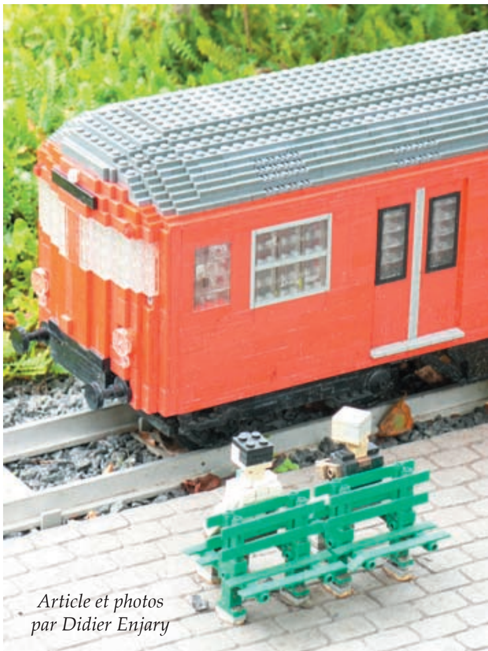
Article et photos par Didier Enjary

18 tenons environ. C'est assez grand - bien sur il ne s'agit plus d'échelle "Minifig" - mais de l'échelle des personnages Miniland, c'est-à-dire du 1:20 environ.