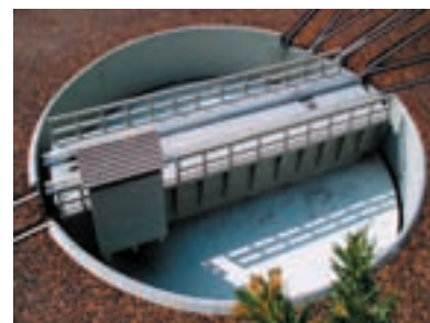
Un pont-tournant qui fonctionne !